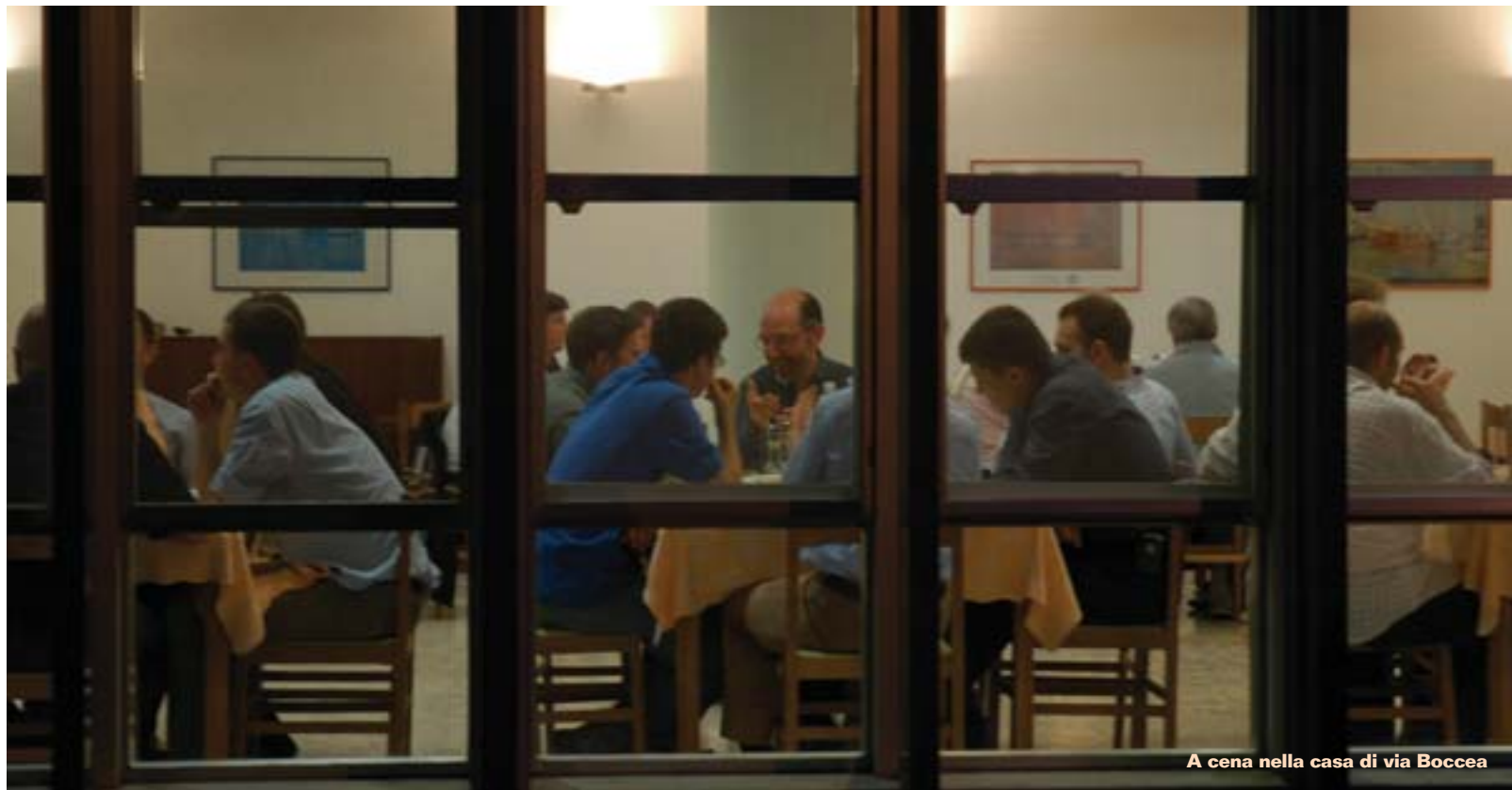
A cena nella casa di via Boccea

CASE DELLA FRATERNITÀ SAN CARLO NEL MONDO: ALVERCA PORTOGALLO ASUNCIÓN PARAGUAY ATTLEBORO USA BOLOGNA ITALIA BOSTON USA BUDAPEST UNGHERIA CITTÀ DEL MESSICO MESSICO EMMENDINGEN GERMANIA FROSINONE ITALIA FUENLABRADA SPAGNA MONTREAL CANADA MOSCA RUSSIA NAIROBI KENYA NOVOSIBIRSK SIBERIA PRAGA REPUBBLICA Ceca ROMA ITALIA SANTIAGO DEL CILE CILE TAIPEI TAIWAN TRIESTE ITALIA VIENNA AUSTRIA WASHINGTON USA