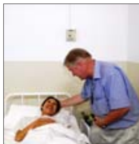
Conforto agli ammalati

con la madre. Mano nella mano, qualche bacio pieno di tenerezza, sempre pronte alle sue necessità. Un dolore non diverso da quello della madre, un dolore della stessa natura. Un dolore che bloccava loro la lingua, perché troppo grande per permettere qualunque forma di linguaggio parlato. Così fino all'ultimo giorno, che ricordo ancora. Era una notte calda, la madre già in coma, le due figlie come ceri ardenti al suo fianco, io nel mezzo. La commozione riempiva i miei occhi di lacrime. Non volevo vederla morire, desideravo che per lei accadesse il miracolo della vita. A un certo punto mi rivolsi alla figlia maggiore e accarezzandole i capelli le dissi: «Forza, figlia mia». Mi guardò con gli occhi bagnati dalle lacrime e mi rispose: «Padre, è un dolore insopportabile, però già chiedo che mia madre riposi in pace. Per me sarà più duro il futuro, però desidero che riposi, ha già sofferto tanto». Epifania, come d'improvviso, aprì gli occhi e ci guardò, guardò le sue figlie. Capii che questo sguardo, tipico di tutti i moribondi, era l'avviso che era giunta l'ora. Era il modo di dare l'addio di tutti quelli che ho visto morire. Passarono due ore ed Epifania raggiunse quello che il suo nome significa. Dio, dopo tanta sofferenza, finalmente le mostrò il suo volto luminoso, le manifestò la gloria divina nella quale ora vive, circondata dagli angeli e dai santi.