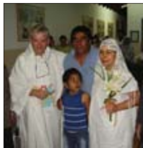
Un matrimonio in corsia