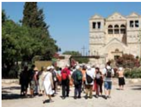
Pellegrini alla Basilica della Trasfigurazione

nostre parole d'angoscia per rendere nostre le sue parole di affidamento filiale.