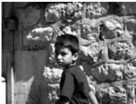
Un bimbo per le strade di Gerusalemme