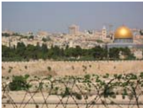
La spianata del Tempio di Gerusalemme vista dal Monte degli Ulivi