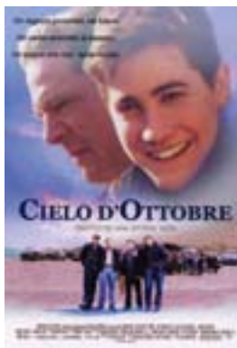
Cielo d'ottobre (J. Johnston, USA 1999)

Due testimonianze su un modo diverso di fare lezione, da Bologna e da Roma