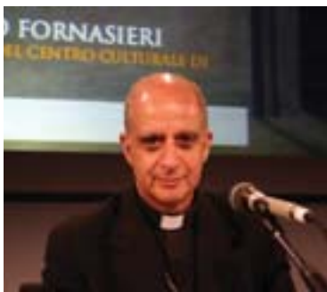
Meeting 2007. Mons. Rino Fisichella, durante la presentazione del libro

A volte scrivere un libro può essere il modo più semplice per dire grazie. Soprattutto se quel libro racconta la storia, imprevista e imprevedibile, che ha cambiato tante vite, compresa quella di chi l'ha scritto.