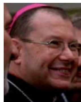
Mons. Paolo Pezzi, arcivescovo della Madre di Dio a Mosca. Di lato, scorcio della capitale russa.

Nella pagina a fianco, immagini da Gerusalemme, dove don Vincent Nagle (foto piccola in basso) collabora con il patriarca latino, Mons. Twal.