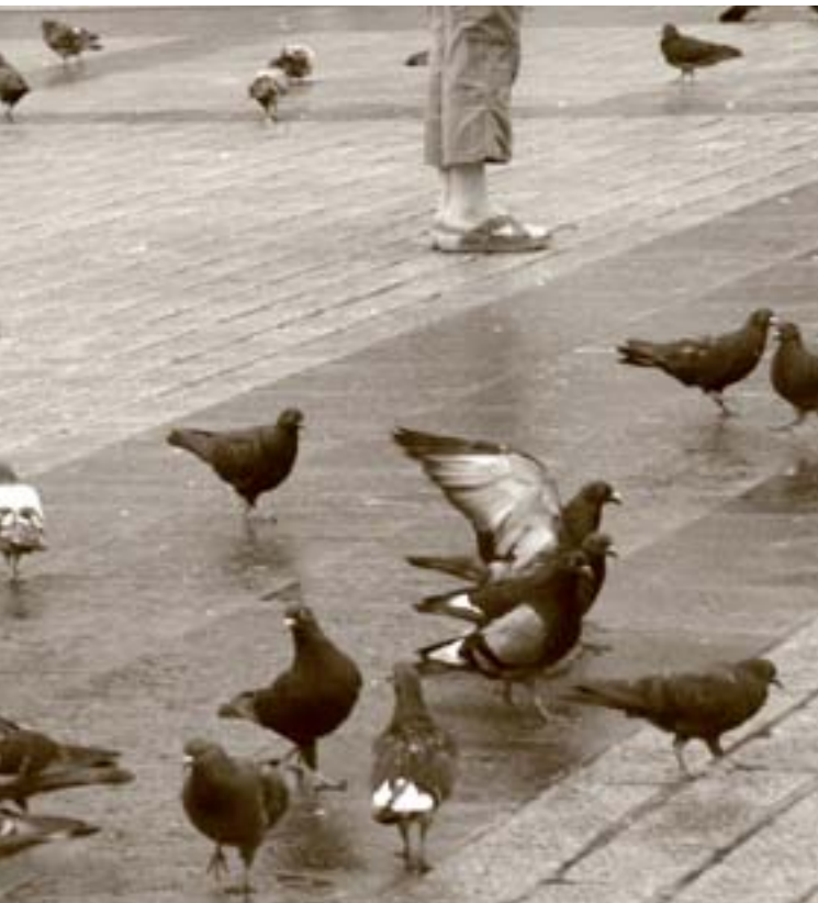
In prima pagina: «Canone inverso - A», Bibione, febbraio 2000, di Elio e Stefano Ciol.

Tutti oggi vogliono dissociarsi il più possibile dagli altri, ognuno vuole gustare la pienezza della vita per se stesso, ma tutti questi sforzi portano non alla pienezza ma alla distruzione di se stessi. Ovunque si dimentica che la vera pienezza non si ottiene attraverso gli sforzi isolati di individui, ma attraverso l'interezza dell'umanità. Fëdor Dostoevskij