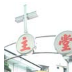
Taipei (Taiwan), iscrizione all'ingresso della chiesa di S. Francis Xavier.

Nella parrocchia più grande, St. Paul Hsin Chuang, si è celebrata la messa e impartita l'unzione degli infermi.