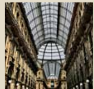
In alto, New York (U.S.A.), scorcio di Wall Street. Sopra, Milano, la galleria Vittorio Emanuele.

ABBONATI O RINNOVA IL TUO ABBONAMENTO. È SEMPLICE. ON LINE: www.sancarlo.org