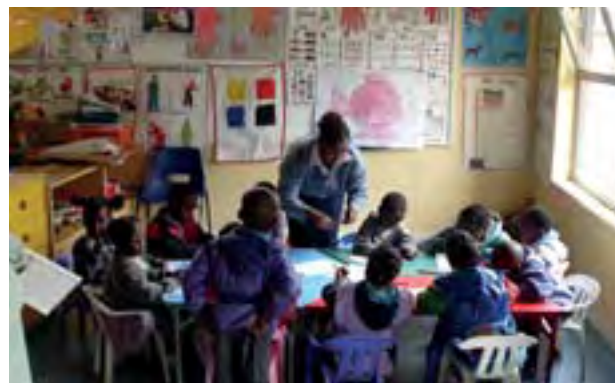
A destra, una classe dell'asilo Emanuela Mazzola, a Kahawa Sukari (periferia di Nairobi, Kenya).

L'esperienza di anni di amicizia profonda con tanti malati di Aids sia in Uganda che in Kenya mi ha aiutato a riconoscere e a contemplare la presenza di Cristo sofferente, morente e vivo nella loro carne. ■