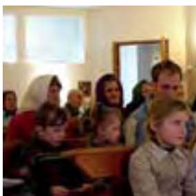
Altro momento della messa nel piccolo villaggio siberiano.