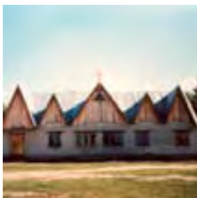
La chiesa di Polovinoje, ex casa della cultura. La parrocchia è il punto di partenza per Francesco verso le lande siberiane.

Come vivi la tua responsabilità di missionario di fronte alle persone che incontri, per cui magari sei l'unico tramite a Cristo, o che, pur di fronte ad una realtà che sembra negare ogni possibilità di bene, hanno conservato una fede salda, certi della positività di tutto?