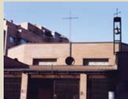
Esterno della chiesa di san Juan Bautista.

È ormai notte quando gli incontri hanno termine, i parrocchiani escono in strada; un ultimo sguardo verso la chiesa, così nascosta tra i palazzi, così presente nei cuori; un cenno di saluto ai sacerdoti e poi via, ognuno verso la propria casa.