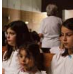
Alverca (Lisbona, Portogallo), bambini sui banchi della chiesa dei Pastorelli.