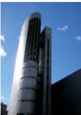
Il carillon della Igreja dos Pastorinhos.