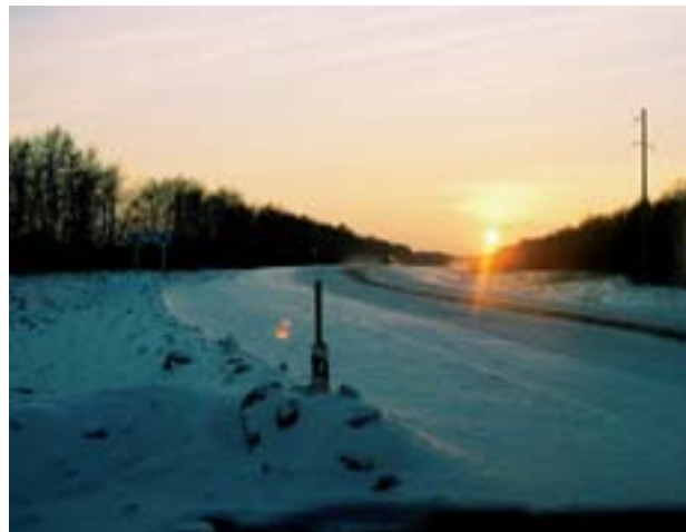
Strada innevata in Siberia.

un vecchio sacerdote che non va più in giro come fate voi a portare il Signore. È davvero bello poter leggere le vostre testimonianze dalle missioni e avere notizia di quello che il Signore opera e costruisce attraverso di voi. Io partecipo da qui alla vostra missione».