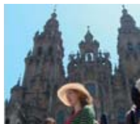
L'arrivo dei giovani pellegrini viennesi, davanti alla cattedrale di san Giacomo.