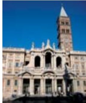
In alto, la basilica di Santa Maria Maggiore, a Roma.