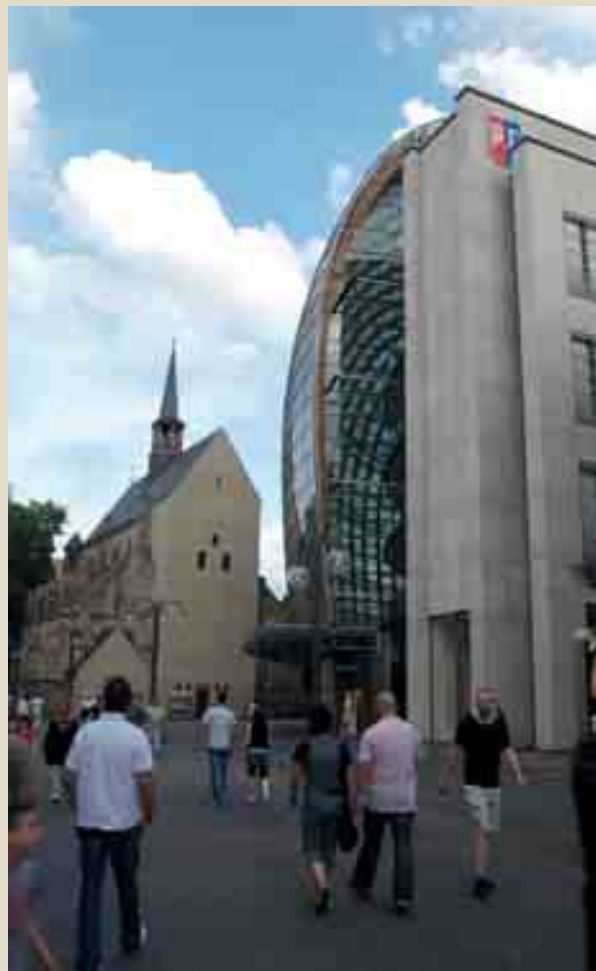
Una via di Colonia sul Reno.