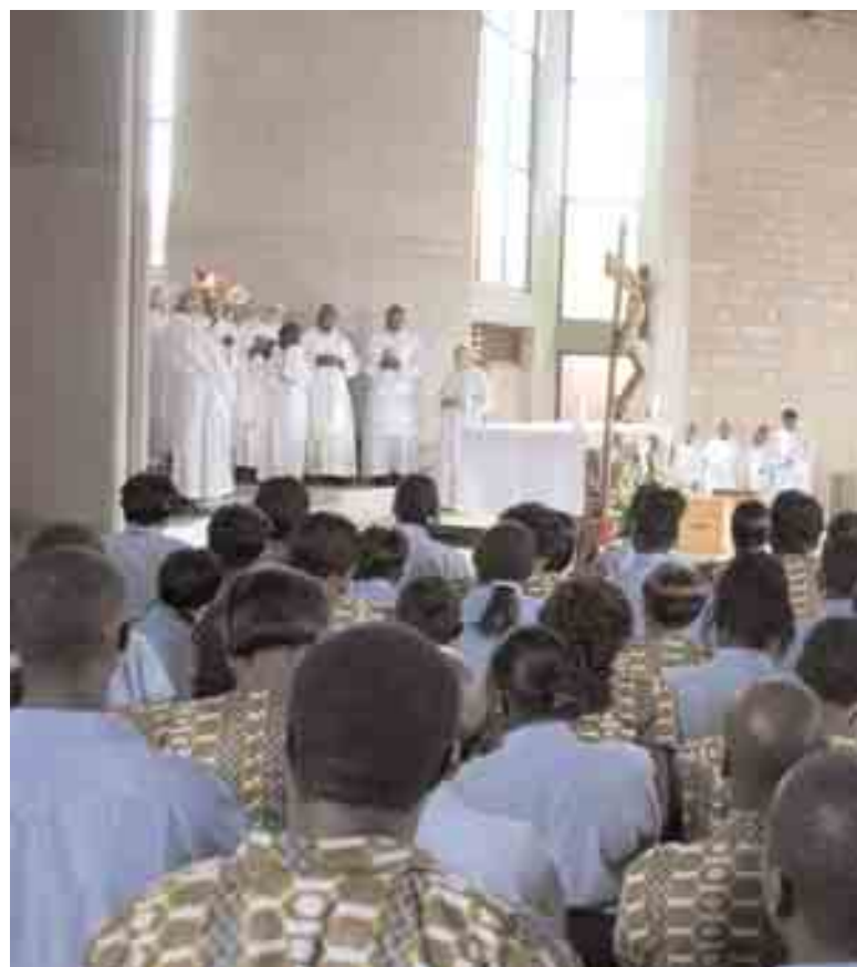
In basso e a fianco, due momenti della consacrazione della chiesa di St. Joseph a Kahawa Sukari, Nairobi (Kenya), il 29 marzo 2009.

Nel vangelo dobbiamo cercare la strada per l'autentica missione cristiana